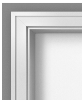
Zarge N Bekleidungsbreite: 70 mm